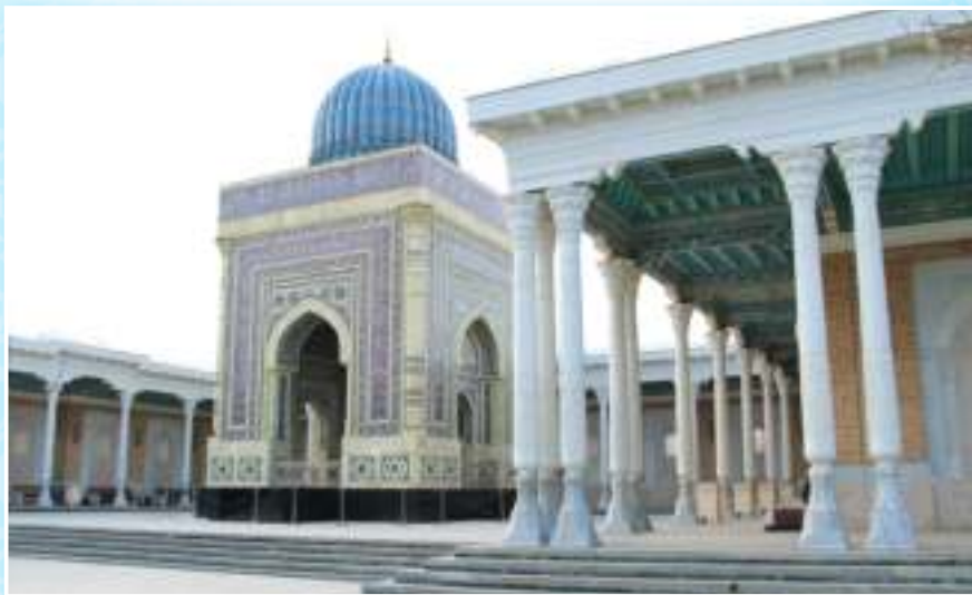
Imom Buxoriy maqbarasi