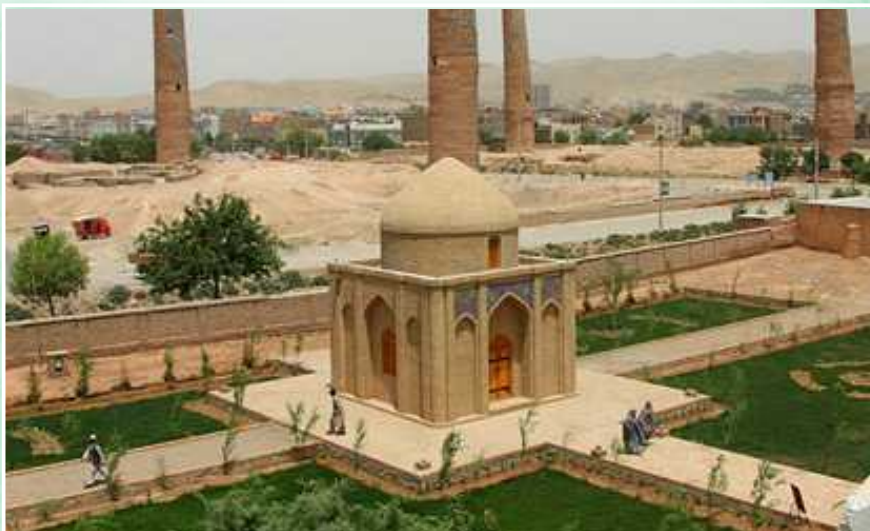
Alisher Navoiy maqbarasi (Hirot)